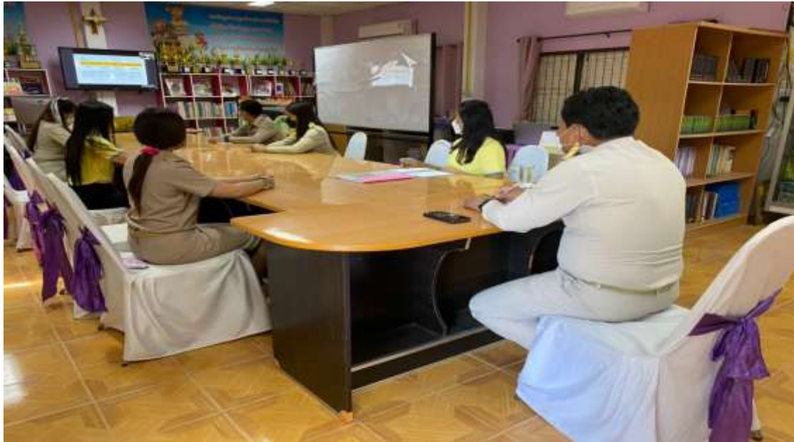
การประชุมคณะกรรมการวิเคราะห์ผลการประเมินคุณธรรมและความโปร่งใสในการบริหารงาน โรงเรียนบ้านชาดวันที 1 เดือน พฤศจิกายน พ.ศ.2565